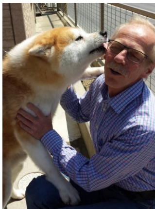
Dag blir vasket 😊