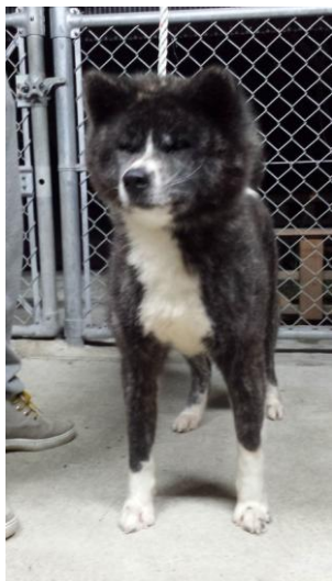
8 år gammel Akita tisper

Selv hadde han akita og shiba, samt "Mameshiba", en mini-Shiba som var mindre i alt, men kraftig bygget, rask som en opptreksleke og hadde bedre pels enn sin "storebror".