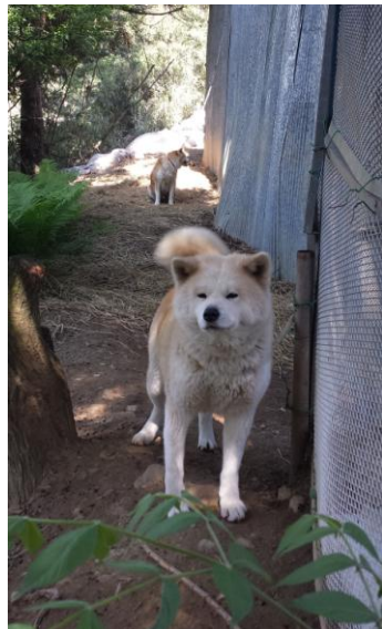
Vennlig tisper som bare logrede med halen 😊