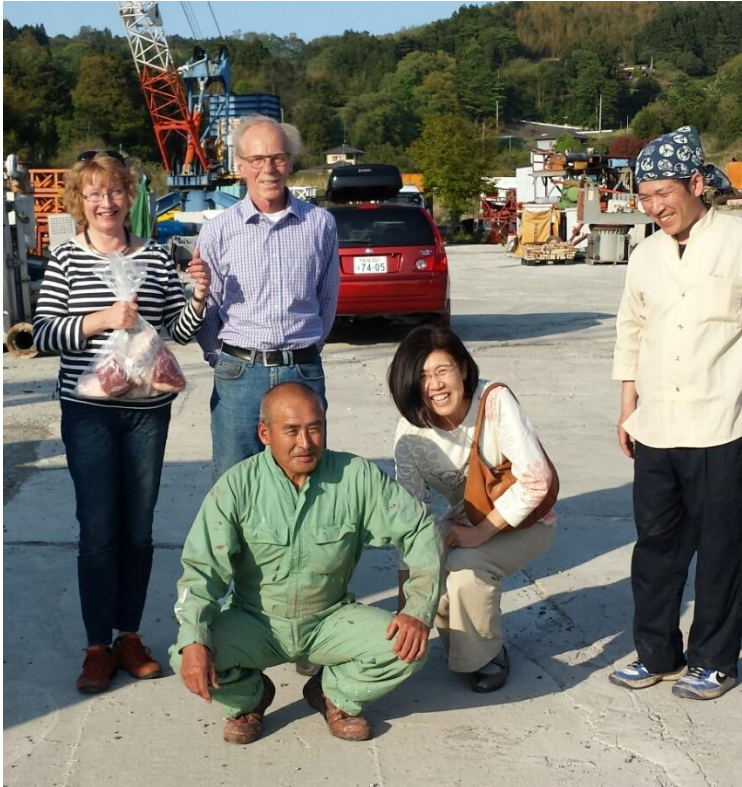
Jegerne delte med seg av dagens fangst.

Som en kuriositet kan nevnes at vi også fikk treffe en tigret valp av den "gamle" typen av akita, etterkrigstypen, som minnet mye om den som vi kalte for "gammel-Nordisk". Det fantes ca 20 oppdrettere av denne typen i Japan i dag men hundene ble ikke registrert.