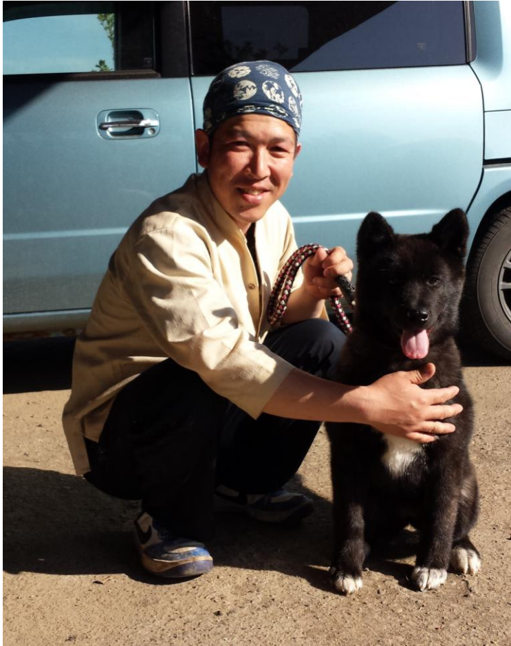
Valp av "etterkrigstype"