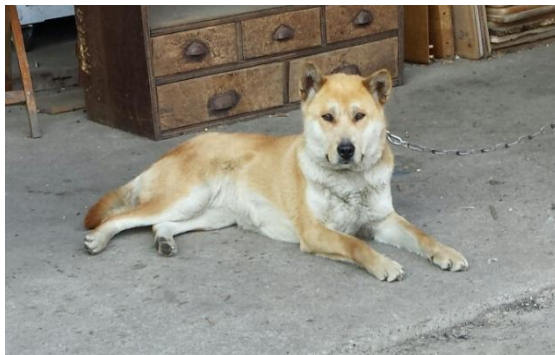
Rød Kishu Inu

På vår rundtur var vi også innom en Kishu kennel som brukte hundene til villsvinsjakt. De hadde "vanlig" Kishu og Kurumi – den opprinnelige jakthundstypen. De hadde også et par røde Kishu, noe som er meget sjelden farge i rasen. Den hvite er jo den vanligste fargen. Dette var tøffe jakthunder så det var ikke aktuelt å klappe dem! Hundene jagede i flokk – en fikk villsvinet ut av hiet, og de andre holder dyret på området, gjennom å nappe i haser og ører, i påvente på at jegeren kom. Det blir ofte skader på hundene og jegerne må selve lappe sammen hundene sine. Det var mye villsvin i bergsområdene i Miyagi, og de åt opp avlingen til bøndene og pløyde opp deres åkrer. Av den grunn betalte bøndene villsvinsjegerne for at de skulle jakte.