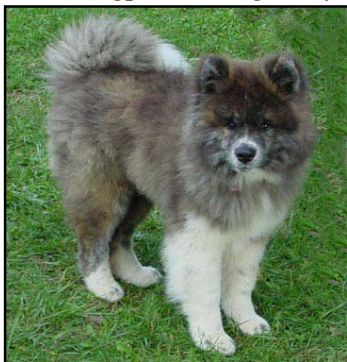
LANGHAR AKITA/ avspeilet seg på utstillingsresultatene fra den tiden. (gen fra KARAFUTO-DOG )

Vi har lite problemer med pelsen på Akita rasen. Det dukker opp enkelte tilfeller av langpels (noe som påstås skyldes tidligere tiders innblanding av Karafuto hund). Et annet problem er der pelslengden er korrekt men hvor dekkhårene er for myke. Mens langpels er en godt synlig og diskvalifiserende feil blir et avvik som for myk pels ofte oversett.