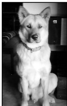
JIRO Og KIKUHIME